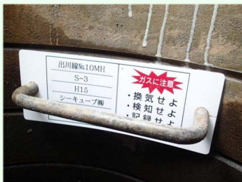
接着剤またはアンカービスで固定