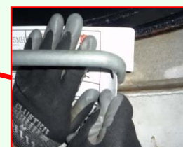
ステップへの取付方法