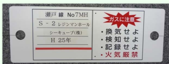
文字記入(テープライター使用例)