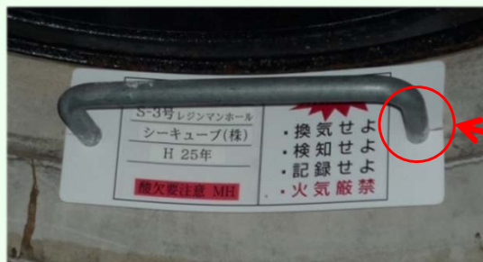
ステップへ取り付け