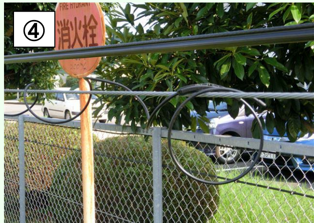
吊線にCCH繰出しリングをセット