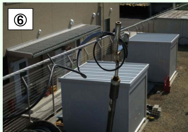
地上アクセス操作棒や牽引ロープでCCHの繰出し補助もできます