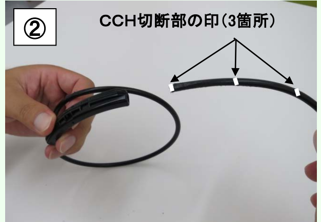
CCH切断部の印(3箇所)の位置で奥まで差し込んで取付ける