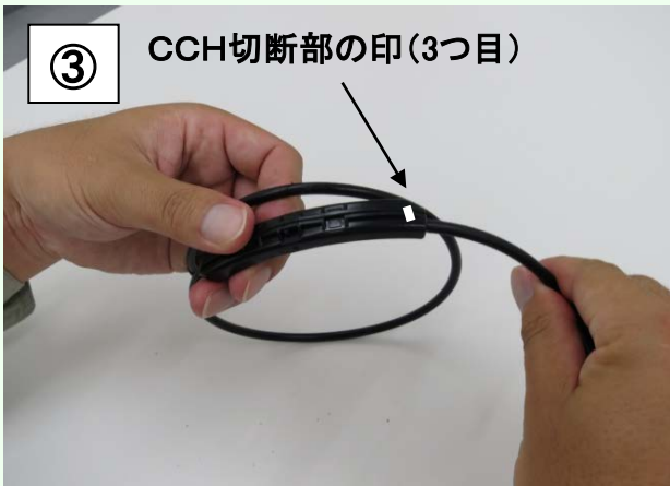
CCH切断部の印(3つ目)まで差し込んだ状態