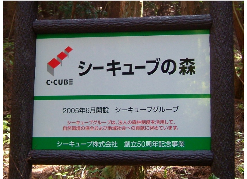
「シーキューブの森」入口看板（遠景）